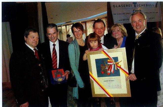
Einer der Höhepunkte der Feierlichkeiten war die Wappenverleihung.

Musikalisch umrahmt wurde das Programm von Familienmitgliedern und Freun-